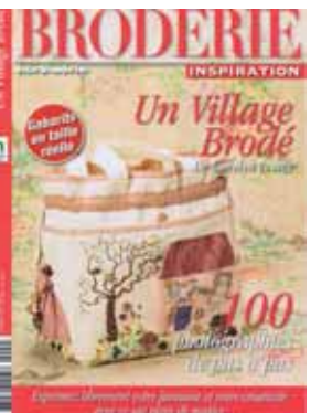
Ref: 19702-4: 9.50€

Nouveau Une belle leçon de fleurs ce superbe livre de Donna Dewberry A réaliser avec les peintures épaisses sur soie, lin ou autres supports !