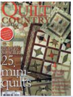
Ref: 18574-3: 8.50€