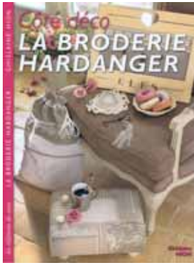
Ref: REED-002: 14.50€