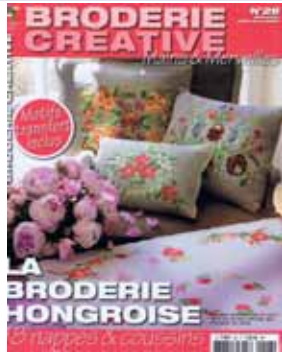
Ref: 11557-28: 7.90€