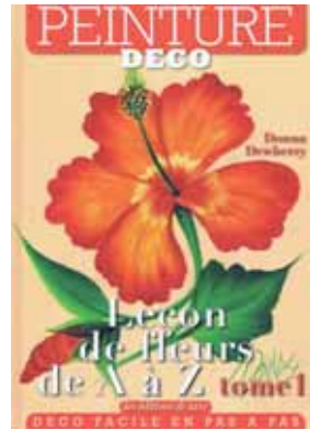
Ref: DECO-011: 14.50€

Nouveau Une belle leçon de fleurs ce superbe livre de Donna Dewberry A réaliser avec les peintures épaisses sur soie, lin ou autres supports !